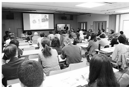
(文/ボランティア 作山 哲平)

消費者の側からともに要求されねばならないでしょう。消費者運動の重要性について確認がなされた後、この日のセミナーは幕を閉じました。